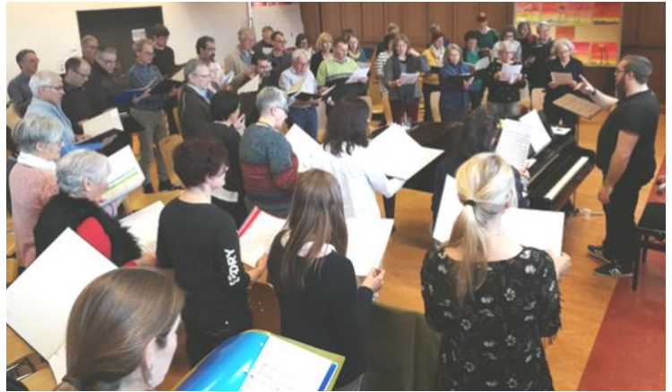
Probe des letzten Chorprojektes zum 250-Jahr-Jubiläum der Kirche

Wer hat Lust, unseren Chor zu verstärken und mit Freude mitzusingen? Wir sprechen alle Menschen an, die gerne singen. Den