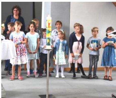
Bild: Die neuen Erstklässler im Religionsunterricht