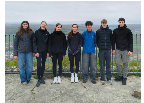
Foto: Auf der Burgruine «Landskron» (Oberelsass) im Konfirmationslager in Mariastein

Sind Sie nun neugierig, was der Schmetterling mit der Seele zu tun hat? Dann kommen Sie in den Gottesdienst!