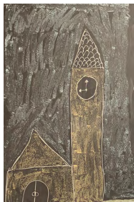
Bild auf der Wandtafel im Unterrichtsraum

Neumondklänge am Dienstag, 16. Juni, Vor- gesang 18.30 Uhr und Feier um 19.30 Uhr. Tauchen Sie ein die mehrstimmigen Melodien aus Taizé und füllen Sie die Leerstelle des Neumonds mit meditativer Musik, biblischen Texten und einem Impuls aus Taizé.